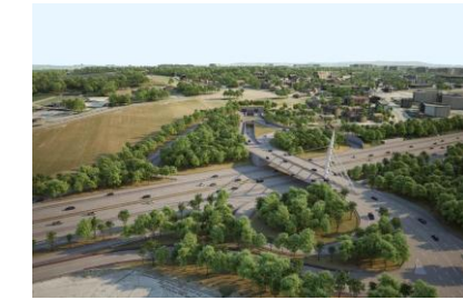
Futur pont haubané sur l'autoroute