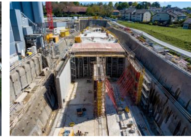
Tranchée couverte Pré-du-Stand