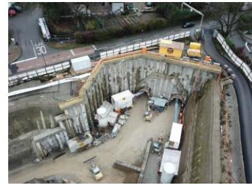
Portail Nord du tunnel